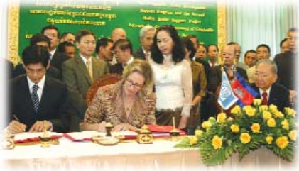
ពិធីចុះហត្ថលេខាលើកិច្ចព្រមព្រៀងជំនួយរវាង មូលនិធិក្រុមប្រឹក្សាអាជ្ញាកណ្តាល ជាមួយធនាគារ ពិភពលោក និង រាជរដ្ឋាភិបាលកម្ពុជា

ក្រុមប្រឹក្សាអាជ្ញាកណ្តាល មានគោលដៅរក្សាវត្តមានរបស់ខ្លួននៅក្នុងប្រទេសកម្ពុជានិរន្តរ៍ ។ ក្រុមប្រឹក្សានេះមិនមែនជាគម្រោងការងារ ឬ កម្មវិធីបណ្តោះអាសន្នទេ ។ ក្រុមប្រឹក្សាអាជ្ញាកណ្តាល គឺជាស្ថាប័នជាតិឯករាជ្យមួយ ដែលត្រូវបានបង្កើតឡើងស្របតាមច្បាប់ របស់ប្រទេសកម្ពុជាដោយមាន សមាសភាពអាជ្ញាកណ្តាលកម្ពុជា ហើយក្រុមប្រឹក្សានេះបានក្លាយទៅជាផ្នែកដ៏សំខាន់មួយនៃវិស័យ ទំនាក់ទំនងវិជ្ជាជីវៈនៅក្នុងប្រទេសកម្ពុជា ។ ជំនួយក្នុងដំណាក់កាលដំបូងដែលអង្គការពលកម្ម អន្តរជាតិបានផ្តល់មកឱ្យក្រុមប្រឹក្សាអាជ្ញាកណ្តាល ត្រូវបានផ្ទេរទាំងស្រុងមកឱ្យមូលនិធិក្រុមប្រឹក្សា អាជ្ញាកណ្តាល ។ មូលនិធិក្រុមប្រឹក្សាអាជ្ញាកណ្តាល គឺជាអង្គការក្រៅរដ្ឋាភិបាលក្នុងស្រុកមួយ គ្រប់គ្រងដោយបុគ្គលិកកម្ពុជា ដែលទទួលភារកិច្ចគាំទ្រ និង សម្របសម្រួលការងាររបស់ ក្រុមប្រឹក្សាអាជ្ញាកណ្តាល ។