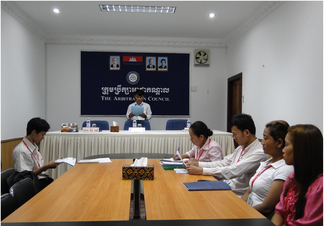
មន្ត្រីលេខាធិការដ្ឋានក្រុមប្រឹក្សាអាជ្ញាកណ្តាលផ្តល់បទបញ្ជាផ្ទៃក្នុងរបស់សវនាការដល់ភាគី

អ្នកត្រូវបានជ្រើសរើសដើម្បីទទួលនូវអ៊ីម៉ែលនេះពីមូលនិធិ ក្រុមប្រឹក្សាអាជ្ញាកណ្តាល ដើម្បីឈប់ទទួលព្រឹត្តិប័ត្រអេឡិចត្រូនិចនេះ សូមអ៊ីម៉ែលទៅ dvandeth@arbitrationcouncil.org ជាមួយប្រធានបទ “Unsubscribe – The AC E-Newsletter”.