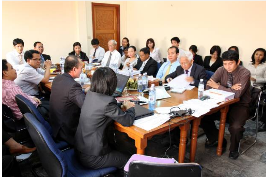
រូបថតទី ១: កិច្ចប្រជុំអាជ្ញាកណ្តាល កាលពីថ្ងៃទី ១២ ខែ មិថុនា ឆ្នាំ ២០១០

ជាមួយគ្នានេះផងដែរ មូលនិធិក្រុមប្រឹក្សាអាជ្ញាកណ្តាល ក្រុមប្រឹក្សាអាជ្ញាកណ្តាល និង លេខាធិការដ្ឋាន ក្រុមប្រឹក្សាអាជ្ញាកណ្តាលបានរៀបចំកិច្ចប្រជុំប្រចាំឆ្នាំ កាលពីខែ មករា និង ធ្នូ ឆ្នាំ ២០១០ ។ ជាលទ្ធផលនៃកិច្ចប្រជុំ ប្រចាំឆ្នាំ មូលនិធិក្រុមប្រឹក្សាអាជ្ញាកណ្តាល ក្រុមប្រឹក្សាអាជ្ញាកណ្តាល និង លេខាធិការដ្ឋានក្រុមប្រឹក្សាអាជ្ញាកណ្តាល បានបង្ហាញអំពីលទ្ធផលសំខាន់ៗ ដែលខ្លួនសំរេចបាន និង ការប្រឈមមុខនានា ក្នុងឆ្នាំ ២០១០ ទាក់ទងទៅនឹង ការដោះស្រាយវិវាទ ការផ្តល់វគ្គបណ្តុះបណ្តាល ផែនការសំរាប់ឆ្នាំ ២០១១ និងសកម្មភាពផ្សេងៗទៀតរបស់ មូលនិធិក្រុមប្រឹក្សាអាជ្ញាកណ្តាល ក្រុមប្រឹក្សាអាជ្ញាកណ្តាល និង លេខាធិការដ្ឋានក្រុមប្រឹក្សាអាជ្ញាកណ្តាល ។ អ្នកចូល រួមបានពិភាក្សាគ្នាយ៉ាងសកម្ម លើការអនុវត្តន៍នៃកិច្ចព្រមព្រៀង ស្តីពីការធ្វើអោយប្រសើរឡើងនូវទំនាក់ទំនងវិជ្ជាជីវៈ នៅក្នុងវិស័យឧស្សាហកម្មកាត់ដេរសំលៀកបំពាក់ ដែលនឹងមានប្រសិទ្ធភាពចាប់ពី ថ្ងៃទី ១ ខែ មករា ឆ្នាំ ២០១១ នេះតទៅ ។ ចុងក្រោយ ក្រុមប្រឹក្សាអាជ្ញាកណ្តាល មូលនិធិក្រុមប្រឹក្សាអាជ្ញាកណ្តាល និងលេខាធិការដ្ឋាន បានលើកឡើងនូវការបេជាចិត្តរបស់ខ្លួន ដើម្បីអនុវត្តសកម្មភាពនានា សំរាប់ឆ្នាំខាងមុខអោយបានជោគជ័យ ។