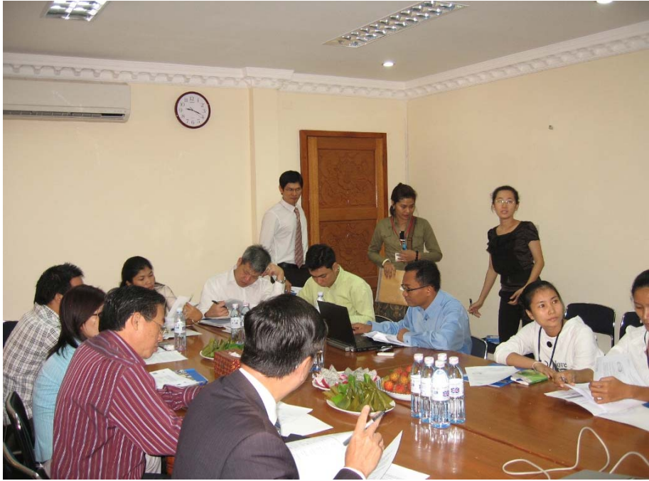
រូបថតទី ៨: វគ្គថែករំលែកព័ត៌មានស្តីពី អនុស្សារណៈ នៃការយោគយល់គ្នា ដល់ភាគីពាក់ព័ន្ធ កាលពីថ្ងៃទី ៩ ខែ ធ្នូ ឆ្នាំ ២០១០

វគ្គពីរផ្សេងគ្នា “ការដោះស្រាយវិវាទការងារ” និង “ការដោះស្រាយវិវាទការងារ និង ក្រុមប្រឹក្សាអាជ្ញាកណ្តាល” ដល់និស្សិតច្បាប់ (ប្រមាណ ៤២៦រូប) ។ (៥) ជំនួយការច្បាប់ សំរាប់បុគ្គលិករបស់ មជ្ឈមណ្ឌលអប់រំច្បាប់សំរាប់ សហគមន៍ អំពីរបៀបរៀបចំសំណុំរឿងសំរាប់ការបើកសវនារបស់អាជ្ញាកណ្តាល ។ (៦) បុគ្គលិកផ្នែកធនធានមនុស្ស និង រដ្ឋបាល (ច្រើនជាង ៣៥រូប) មកពីរោងចក្រកាត់ដេរផ្សេងៗ ស្តីពីការរៀបចំនិង បង្ហាញសំណុំរឿងជាមុន សំរាប់ក្រុមប្រឹក្សាអាជ្ញាកណ្តាល ។ (៧) អង្គការក្រៅរដ្ឋាភិបាលនានា នៅកម្ពុជា (៥០រូប) ស្តីពី ដំណើរការ ដោះស្រាយវិវាទការងារ និងក្រុមប្រឹក្សាអាជ្ញាកណ្តាល ។ (៨) អ្នកអប់រំផ្នែកច្បាប់ (១៧រូប) ស្តីពី វគ្គបណ្តុះបណ្តាល គ្រូបង្គោលលើក្របខ័ណ្ឌច្បាប់ សំរាប់ការចរាចរអនុសញ្ញារួមនៅកម្ពុជា ។ (៩) អ្នកផ្សះផ្សា (៣០រូប) របស់ក្រសួង ការងារនិងបណ្តុះបណ្តាលវិជ្ជាជីវៈ ស្តីពីបច្ចេកទេសផ្សះផ្សា ដោយផ្តោតសំខាន់លើវិធីផ្សះផ្សារវិវាទដ៏ល្អ បំផុតរវាង សហជីព និង សហជីព របៀបដើម្បីចរាចរលើអនុសញ្ញារួម និងរបៀបបញ្ចុះបញ្ចូលភាគី ដើម្បីអនុវត្ត ជាមួយនឹង អនុសញ្ញារួមដែលពួកគេមានស្រាប់ ។ (១០) សមាជិកក្រុមប្រឹក្សាឃុំ/សង្កាត់ (ប្រមាណ ១០០រូប) ស្តីពី បច្ចេកទេសផ្សះផ្សា ។