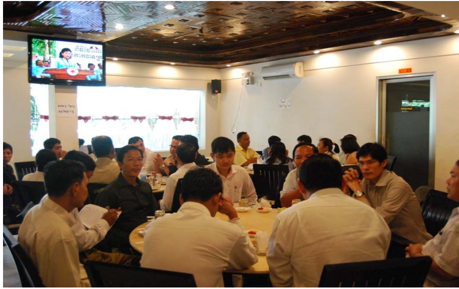
រូបថតទី ៥: កម្មវិធី "Meet & Greets" រវាងនិយោជិត និង អាជ្ញាកណ្តាល កាលពីថ្ងៃទី ១៤ ខែ សីហា ឆ្នាំ ២០១០