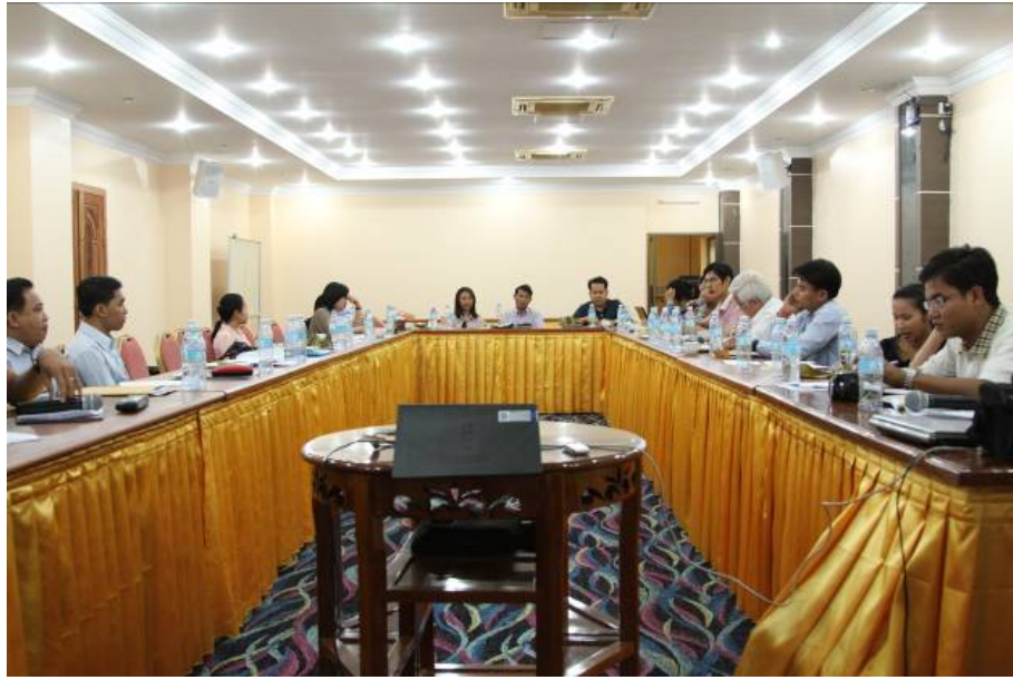
រូបថតទី ២: កិច្ចប្រជុំប្រចាំឆ្នាំ របស់គ្រួសារក្រុមប្រឹក្សាអាជ្ញាកណ្តាល កាលពីថ្ងៃទី ១៧-១៩ ខែ ធ្នូ ឆ្នាំ ២០១០ នៅខេត្ត ព្រះសីហនុ