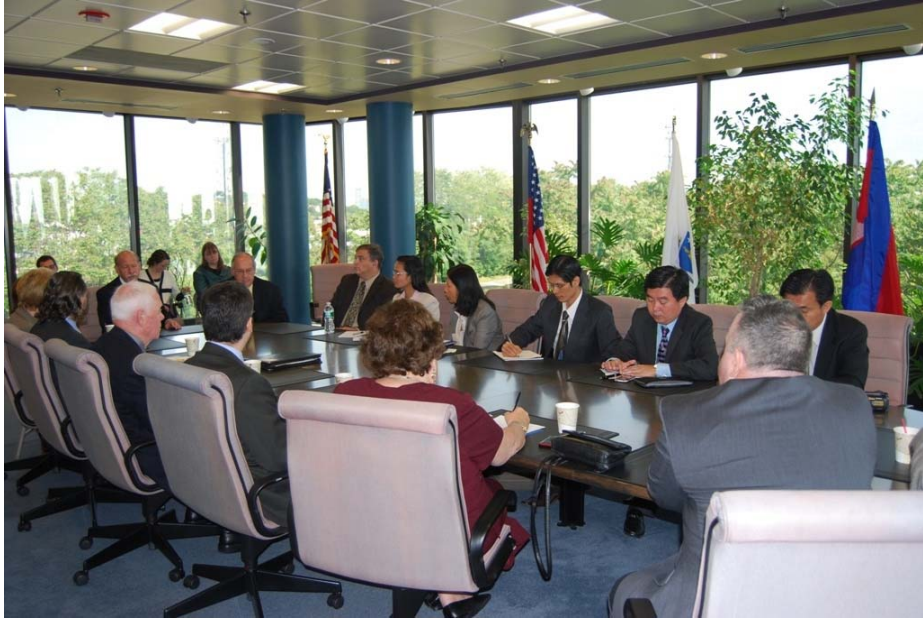
រូបថតទី ៤: ទស្សនកិច្ចសិក្សានៅសហរដ្ឋអាមេរិក កាលពីថ្ងៃទី ២២-២៩ ខែ ឧសភា ឆ្នាំ ២០១០