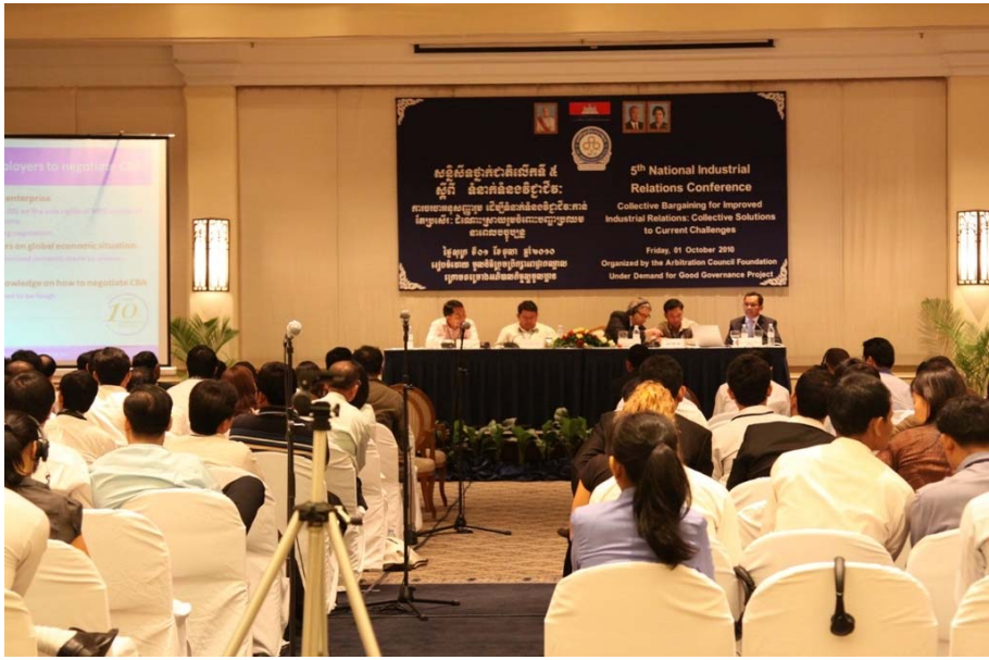
រូបថតទី ៧: សន្និសីទថ្នាក់ជាតិលើកទី ៥ ស្តីពីទំនាក់ទំនងវិជ្ជាជីវៈ កាលពីថ្ងៃទី ១ ខែ តុលា ឆ្នាំ ២០១០

ជាមួយគ្នាផងដែរ កាលពីថ្ងៃទី ២៣ ខែ សីហា ឆ្នាំ ២០១០ មូលនិធិក្រុមប្រឹក្សាអាជ្ញាកណ្តាលបានរៀបចំ សន្និសីទថ្នាក់ជាតិលើកទី ៥ ស្តីពីទំនាក់ទំនងវិជ្ជាជីវៈ នៅសណ្ឋាគារសាន់វេ។ ប្រធានបទឆ្នាំនេះ គឺ ការចរចា អនុសញ្ញារួម ដើម្បីទំនាក់ទំនងវិជ្ជាជីវៈកាន់តែប្រសើរៈ ដំណោះស្រាយរួម ចំពោះបញ្ហាប្រឈម នាពេលបច្ចុប្បន្ន ។ សន្និសីទនេះ មានអ្នកចូលរួមប្រមាណ ១៨០នាក់ មកពីអង្គការផ្សេងៗ ដូចជា សហជីពពាណិជ្ជកម្ម សមាគមនីយោជក ក្រុមហ៊ុនឯកជន អង្គការពលកម្មអន្តរជាតិ ស្ថានទូតនានា អង្គការសង្គមស៊ីវិល និង អង្គការដែលកំពុងធ្វើការងារក្នុងវិស័យទំនាក់ទំនងវិជ្ជាជីវៈ។ សន្និសីទនេះ ត្រូវបានភ្នាក់ងារយកព័ត៌មានមួយចំនួនដូច ជា កាសែតស្ថាបនា កាសែតកោះសន្តិភាព ទូរទស្សន៍បាយ័ន និងវិទ្យុមហានគរ។