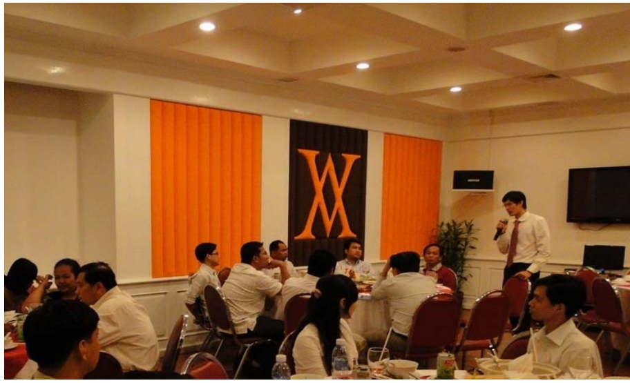
រូបថតទី ៦: កម្មវិធី "Meet & Greets" រវាងនិយោជក និង អាជ្ញាកណ្តាល កាលពីថ្ងៃទី ៣ ខែ កញ្ញា ឆ្នាំ ២០១០

នៅក្នុងកំរិតនៃគម្រោងអភិបាលកិច្ចលម្អូលដ្ឋាន មូលនិធិក្រុមប្រឹក្សាអាជ្ញាកណ្តាលបានចាប់ដៃគូជាមួយនឹងភ្នាក់ងារអនុវត្តគំរោងផ្សេងៗ ដូចជា វិទ្យុជាតិកម្ពុជារបស់ក្រសួងព័ត៌មាន ក្រសួងទំនាក់ទំនងរដ្ឋសភា-ព្រឹទ្ធសភា និងអធិការកិច្ច ការិយាល័យច្រកចេញ-ចូលតែមួយ របស់ក្រសួងមហាផ្ទៃ និង អង្គការមូលនិធិអាស៊ី ។ រហូតដល់ខែ ធ្នូ ឆ្នាំ ២០១០ មូលនិធិក្រុមប្រឹក្សាអាជ្ញាកណ្តាលបានកសាងភាពជាដៃគូជាមួយនឹង ២៥ ស្ថាប័ន ( រួមមានទាំងស្ថាប័នរដ្ឋ និង មិនមែនរដ្ឋ ) ។